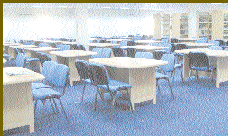
كتب - بدر البوسعيدى:

منذ افتتاح مكتبة جامعة نزوى وهي تسير قدما نحو التقدم وخدمة جميع مرتاديها بمختلف مستوياتهم وبشتى الخدمات المتوفرة لديها، فبالإضافة إلى كون المكتبة القلب النابض لهذا الصرح العلمي التامى الكبير فهي أيضاً مرجع أساسي لكل متعلم ودارس ومثقف، وهي بشكلها الحالي والحصري المتعاشي وتطور الجامعة تعد المكان المفضل لتغذية العقل واكتساب المعلومات ، وموظفو المكتبة يعملون بشكل مستمر وفعال من أجل النهوض بمستوى خدمات المكتبة، ومن أجل تهيئة المناخ الفكري المناسب للاستفادة من هذه الخدمات فلفد تم يعون الله وتوفيقه اكتمال مبنى مكتبة الجامعة، وظهر أقسام المكتبة بشكل أفضل بعد أن كانت مدمجة مع بعضها وتم تخصيص موظف مختص لكل قسم حتى يتسنى للجميع الاطلاع والاستفادة بشكل أكثر فعالية وراحة.